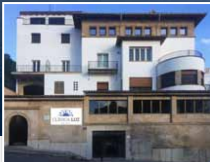
In Kooperation mit:

Im Anschluss planen wir gemeinsam mit Ihnen Ihre Therapie.